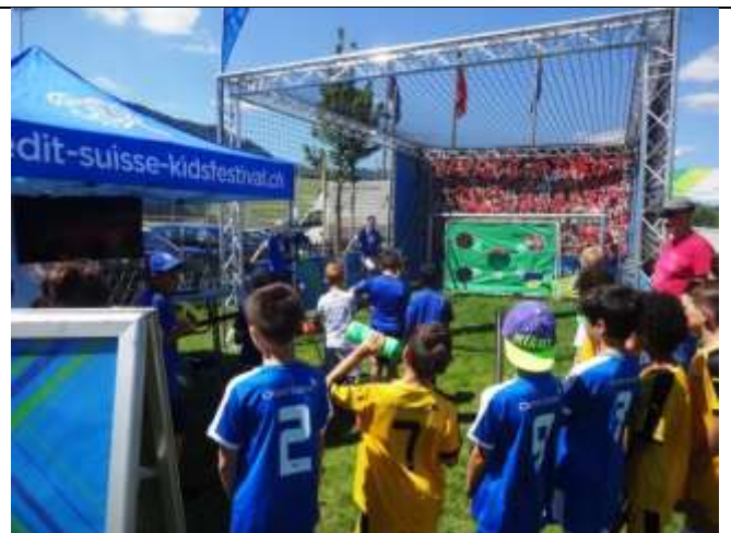
Am SFV-Kids-Festival am 18. Juni 2017 beim FC Littau war die Torschussanlage mit dem Robo Keeper der grosse Renner

Jahrelang waren die Juniorenturniere um den «Baumann-Cup» (=Patronat Hebi Baumann), der Junioren-D-20er-Club-Cup, der international bekannte HUWI-Cup (Michi Huber / Urs Wicki) und der AXA-Cup die grossen Vorbereitungsturniere für Mannschaften aus der ganzen Schweiz beim FC Littau