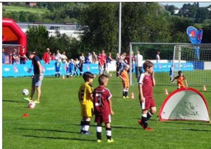
Am SFV-Kids-Festival am 18. Juni 2017 spielten die jüngsten Spieler der G-Junioren ohne Schiedsrichter auf kleine PUGG-Tore.

Im Rahmen des Jubiläums „60 Jahre FC Littau“ bestätigte der Verein seinen guten Ruf als Gastgeber grosser Juniorevents.